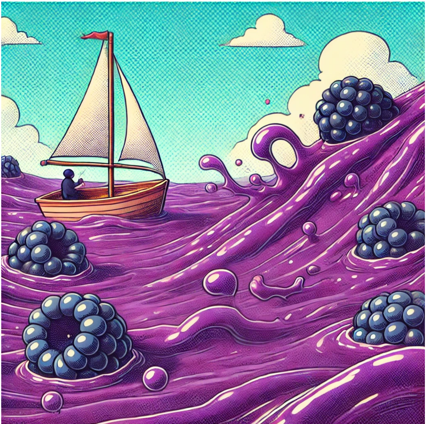
Image : Imaginez-vous naviguer sur une MeR remplie de confiture de MûRes.